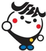
日弁連広報キャラクター ジャフバくん