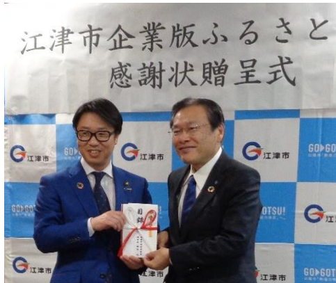
《江津市 贈呈式 令和6年5月7日》