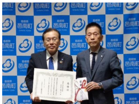
《邑南町 贈呈式 令和6年5月7日》