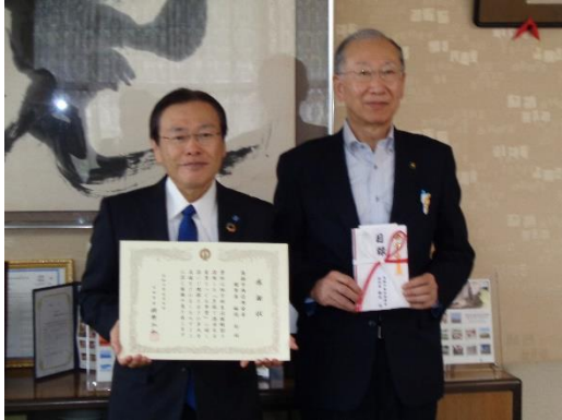
《大田市 贈呈式 令和6年5月7日》