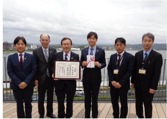
《松江市 贈呈式 令和6年5月8日》